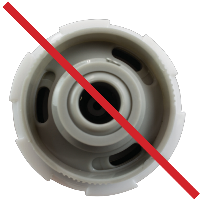
Tryska Obrázek 1

Nastavte hlavu postřikovače vhodně a bez nadměrné síly. Správná poloha při použití je znázorněna na obrázku; "Obrázek trysky 2".